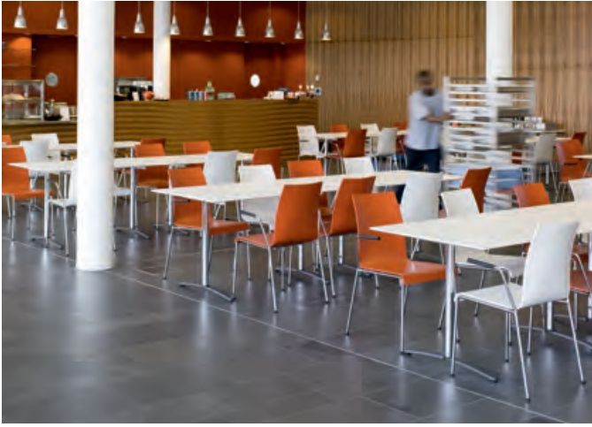
Espace dédié à la pause : prime dans une cantine.