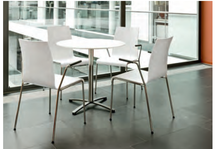
Polyvalente. prime s'adapte aux situations les plus variées et reste un partenaire hors pair en petit comité.