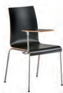
1090 avec tablette écrivain