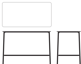
MANGE DEBOUT 7773/0