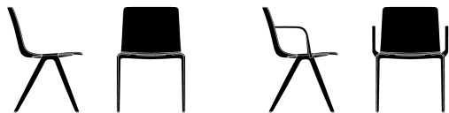
COQUE BOIS/PIÉTEMENT ALUMINIUM