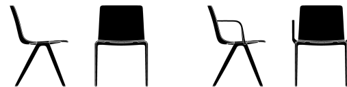
COQUE SYNTHÉTIQUE/PIÉTEMENT ALUMINIUM